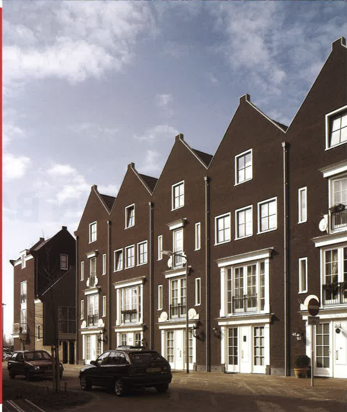
▲ Vestingstad, Schuytgraaf (Mulleners + Mulleners)

kappen, zijn groene gazons, veranda's en oprijlanen met de auto voor de deur met het relaxte gevoel van de film American Beauty . Maar het Amerikaanse gevoel heeft ook een ordentelijke Hollandse vertaalslag ondergaan, door de huizen enorme bakstenen gevelvlakken te geven in rood, roodbruin of geel (allemaal van INBO ARCHITECTEN). Om de zwaarte te abstraheren en een vrolijke lichtheid aan te brengen, heeft het voegwerk de kleur van de baksteen.