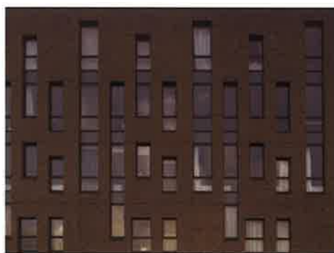
▲ Haveneiland West, IJburg (Van Sambeek & van Veen architecten)