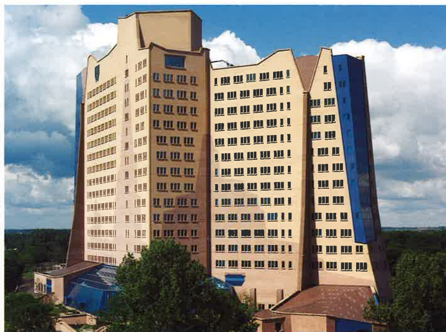
▼ Gebouw De Gasunie, Groningen (Architectenbureau Alberts & Van Huut)

Over veel zaken heeft KNB technische brochures beschikbaar. Kijk verder op www.knb-baksteen.nl en www.betrouwbaarbaksteen.nl