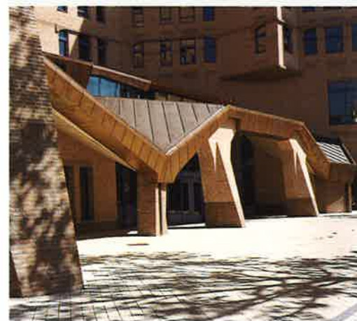
▲ Gebouw NMB Bank, Amsterdam-Zuidoost (Architectenbureau Alberts & Van Huut)

Helaas is het voegwerk van dit project niet mechanisch verdicht, waardoor het relatief kwetsbaar is voor uitloging. Dit proces heeft ertoe geleid dat de voegen regelmatig moeten worden vervangen. Dat is jammer en de ontwerpers hebben dan ook alles uit de kast gehaald om dit probleem in volgende projecten te vermijden. In het gebouw van de Gasunie in Groningen is een hardere, minder sterk zuigende baksteen toegepast. Om muizentrapjes te voorkomen zijn veel verschillende vormstenen toegepast, waardoor het wateropnemend vermogen van de gevel in metsel- en voegmortels is toegenomen. In de uitvoering is veel aandacht geschonken aan bescherming van het verse metselwerk tegen overvloedig hemelwater. Dankzij alle maatregelen is een perfect