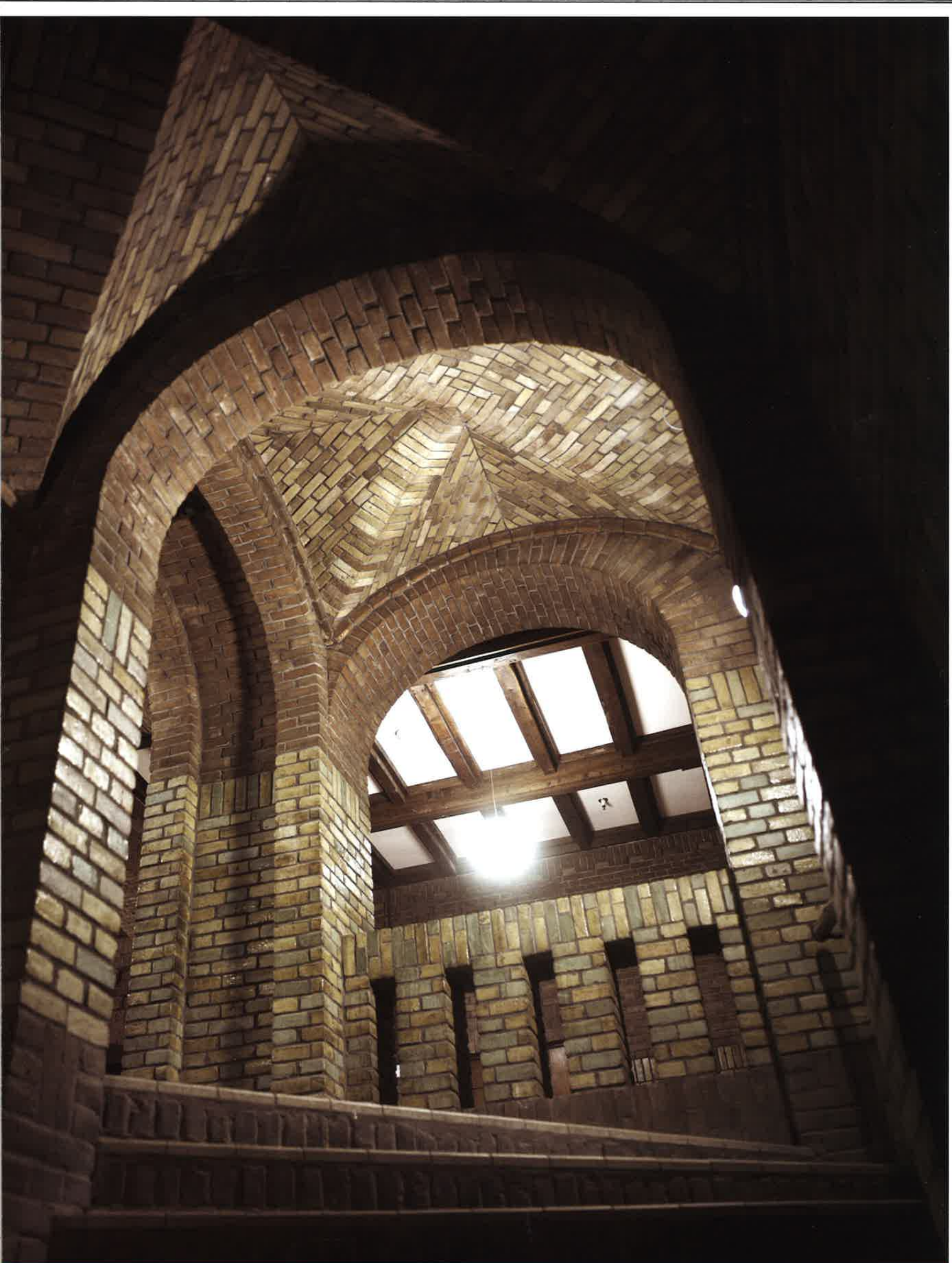
▲ Gebouw De Inktpot, Utrecht (Van Heukelom)