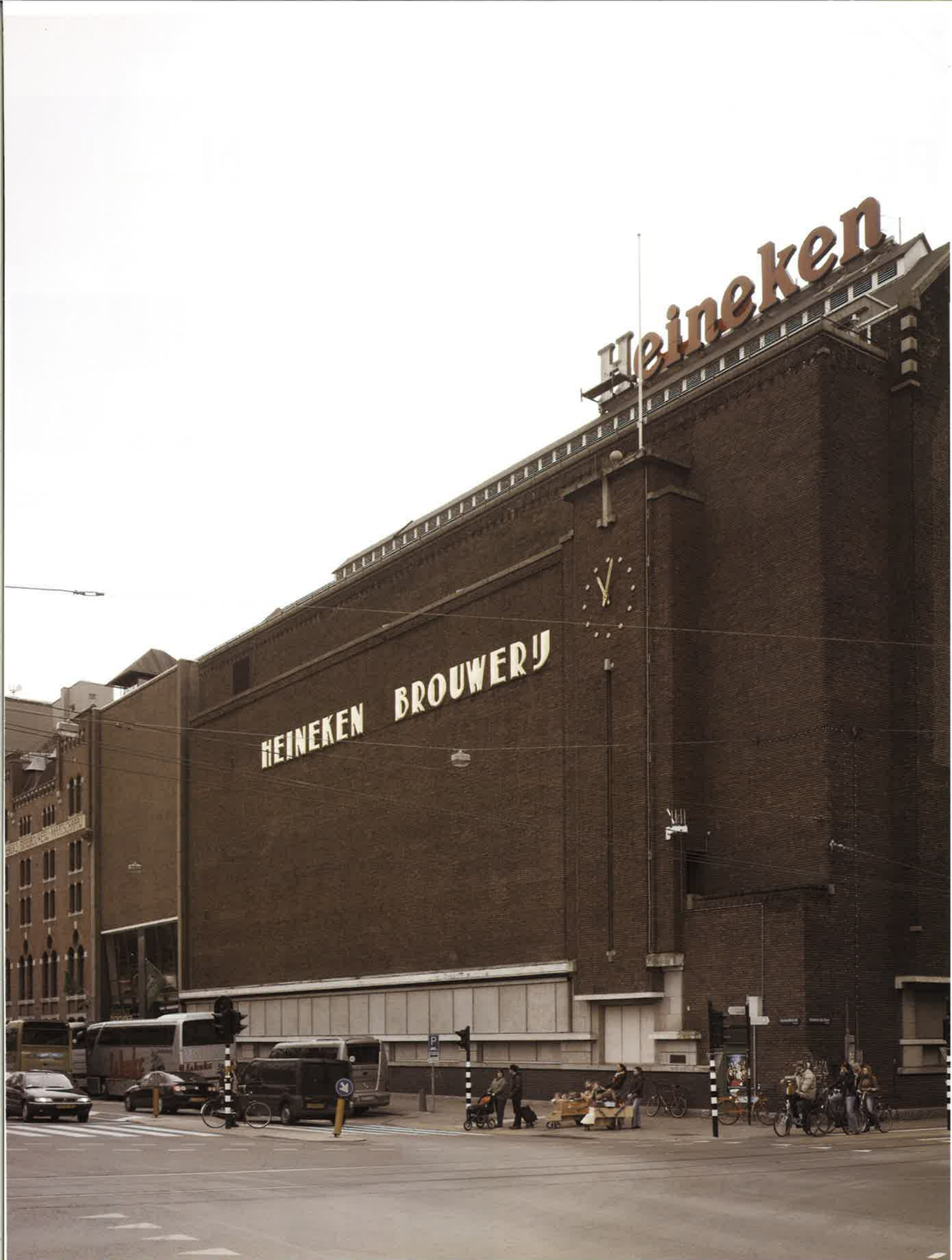
▲ Heineken Brouwerij, Amsterdam (J. Gosschalk)