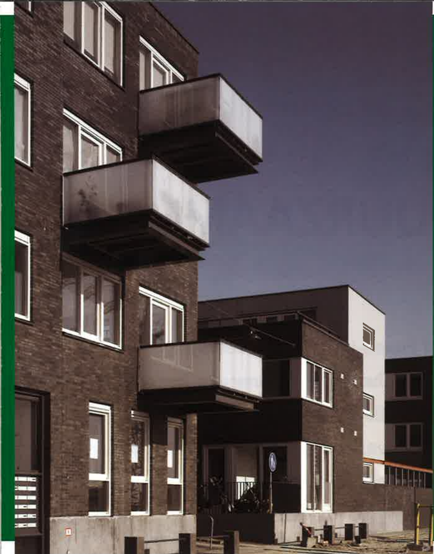
▲ Haveneiland West, Piet Zwarthof, IJburg (Quist Wintermans Architecten)