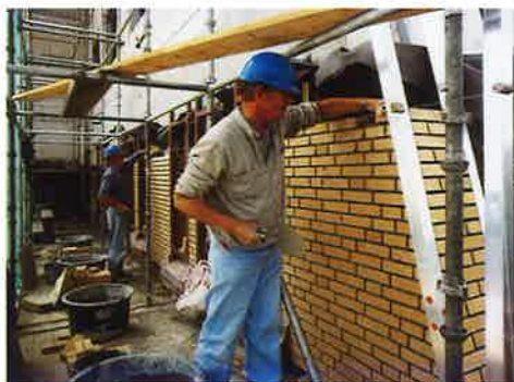
▲ Toepassing uitgekende metsel- en voegmortels

Het betreft een bakstenen gebouw met robuust ogende hellende gevels. Deze gevels worden door het hellende karakter sterk met hemelwater belast. De bakstenen zelf zijn daar goed tegen bestand, maar metselwerk is een samenvoeging van baksteen met mortel. De mortel is hard nodig om aan alle technische vereisten te kunnen voldoen. Zwakke plek van hellend metselwerk is echter de inwerking van (zure) regen op de mortel. Bij een goede afstemming van de mortel op de baksteen en een goede uitvoering heeft baksteen metselwerk een hoge duurzaamheid. Maar de ontwerpaspecten zijn van minstens even groot belang.