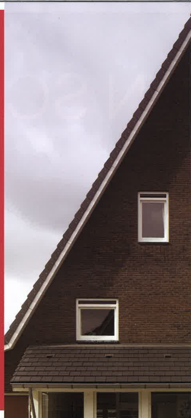
▲ De Amerikaanse Wijk, Schuytgraaf (Inbo Architecten)