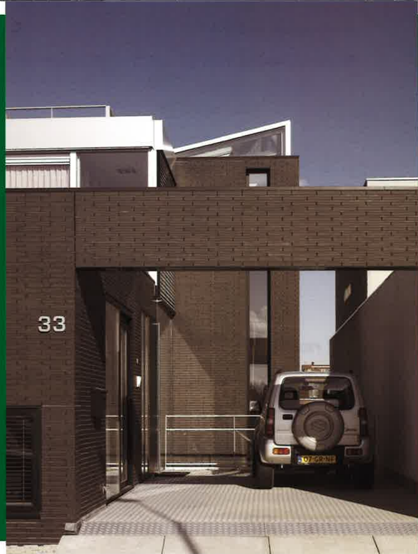
▲ Vrije kavel Kleine Rieteiland, IJburg (Maaskant en Van Velzen Architecten)