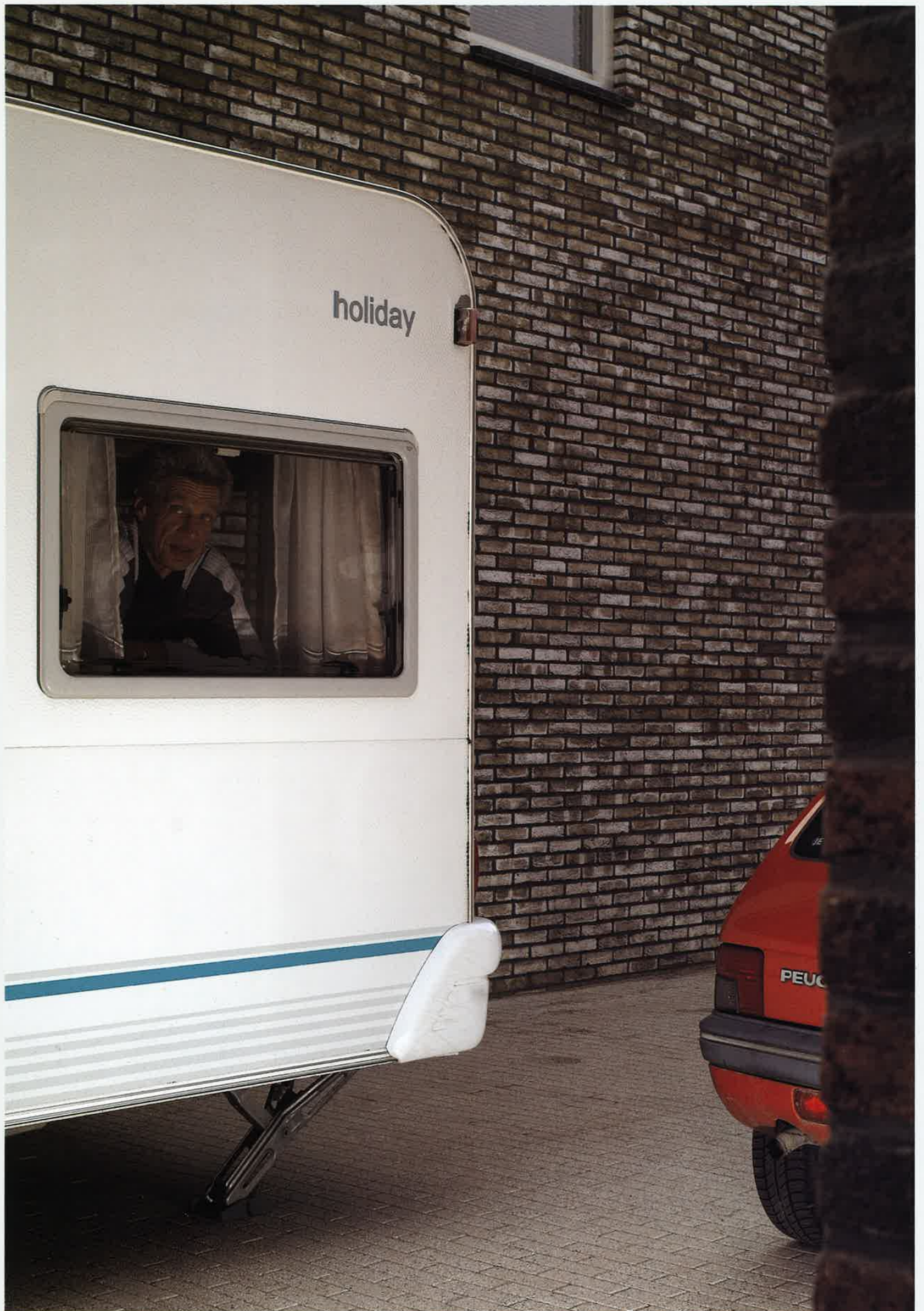
DE AMERIKAANSE WIJK, SCHUYTGRAAF