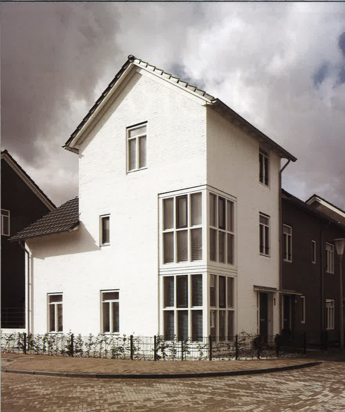
▲ Vestingstad, Schuytgraaf (Mulleners + Mulleners)