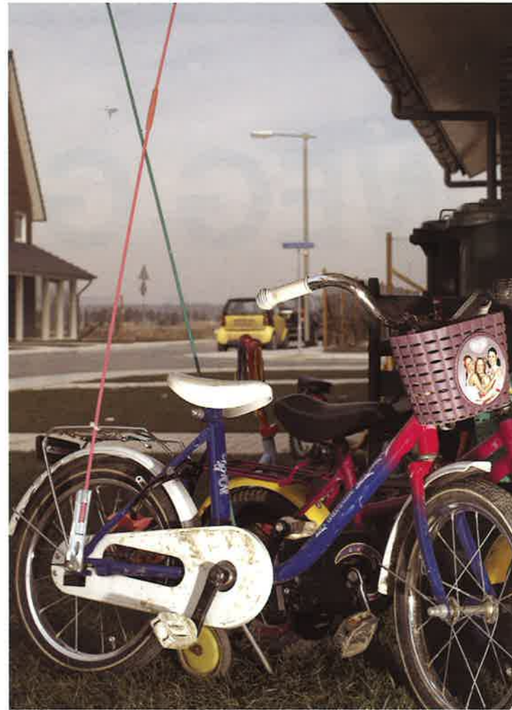
Leven in de Amerikaanse Wijk, Schuytgraaf ▲ Foto's Corné Bastiaansen