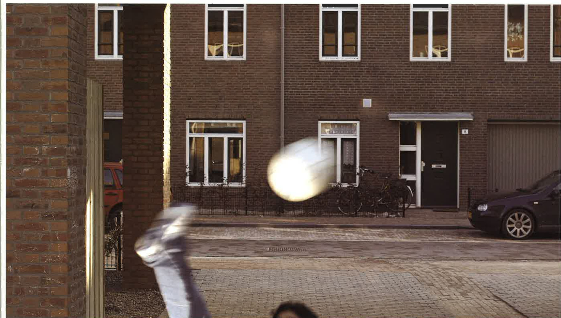
Leven in de Amerikaanse Wijk, Schuytgraaf

Zijn voorzittersfunctie van de bewonersvereniging geeft hem een gezicht in de buurt, een rol die hij met een natuurlijk panache lijkt te vervullen. 'Je moet zorgen een constructieve overlegpartner te zijn van de ontwikkelingsmaatschappij en de gemeente,' zegt hij geroutineerd. 'Maar je moet ook niet te goedgelovig zijn. Er wordt veel beloofd, en uiteindelijk wordt dat wel waargemaakt waarschijnlijk, maar de termijn waarop dat gebeurt is veel minder zeker. Het komt er op neer dat je de verwachtingen over en weer goed regelt.'