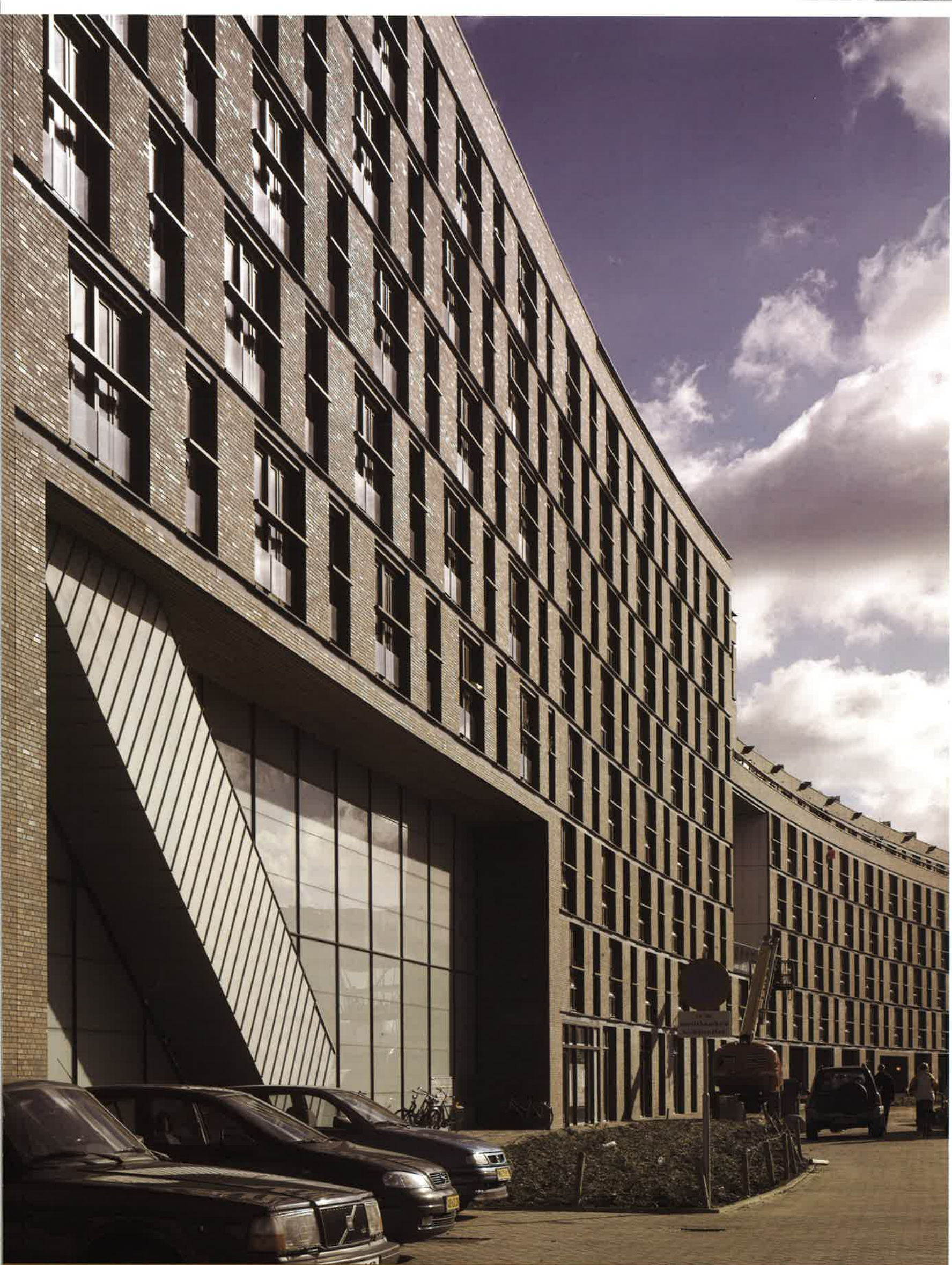
▲ Gebouw 'Hidden Delights', Funen-park, Amsterdam (Frits van Dongen, Architecten Cie)