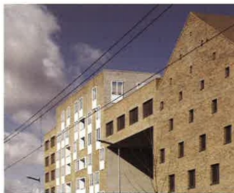
Haveneiland West, Adriaan Ditvoorsthof, IJburg ►► (ANA Architecten)