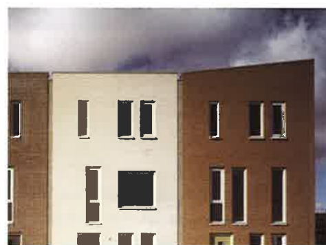
▲ Stijgereiland, IJburg (DRO)

in Den Haag, alleen intiemer en nog gevarieerder. Er is gestrooid met wisselende entrees, luifels, versierde bovendorpels, matglazen afscheidingen en balustrades, en ook met verschillen in hoogtes. Bovendien staat het hele hof op een plateau waardoor er ruimte is voor een parkeergarage. De verhoogde binnenstraat krijgt daardoor het karakter van een dijkje – wat is er meer passend op een eiland? Het is een van de interessantste stedenbouwkundige voorzetten, omdat de tegen de dijk aangelegde appartementen de openbare weg van het privé-domein scheiden. Er zijn ouderwetse bordessen, souterrains en trappen naar de woning.